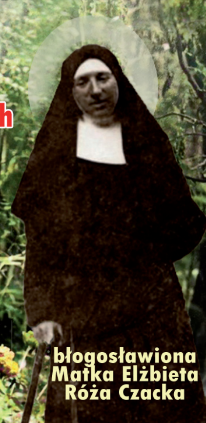
błogosławiona Matka Elżbieta Róża Czacka