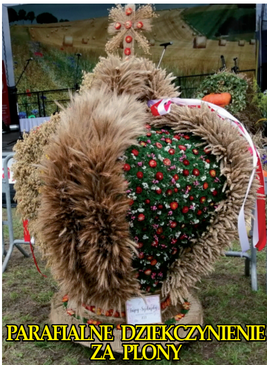
PARAFIALNE DZIEKCZYNIENIE ZA PŁONY