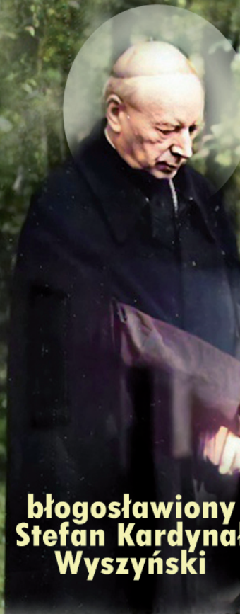
błogosławiony Stefan Kardynał Wyszyński

NOWI BŁOGOSŁAWIENI KOŚCIOŁA KATOLICKIEGO 12 września 2021 roku