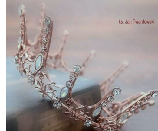
ks. Jan Twardowski

My boimy się ostatniego miejsca w życiu. Tymczasem tam można się spotkać z samą Królową.